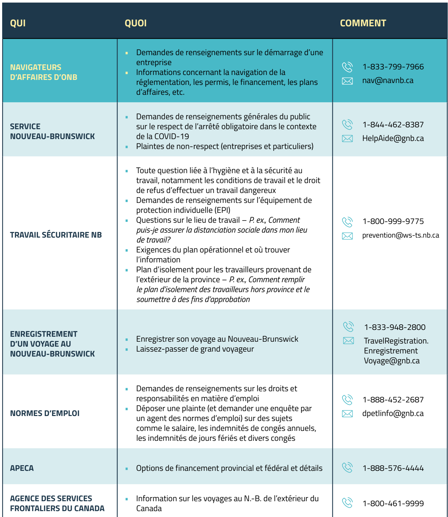
Tableau d'enquête auprès des entreprises du Nouveau-Brunswick